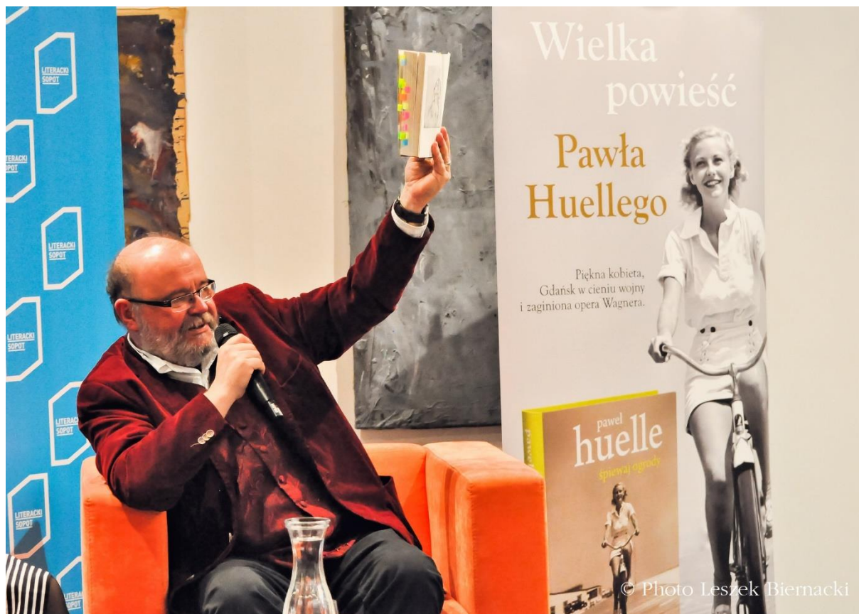
Paweł Huelle podczas promocji książki Śpiewaj ogrody, Sopot, 14 stycznia 2014 r. Urządzono ją w Państwowej Galerii Sztuki i dlatego towarzyszyły jej obrazy na ścianach, a z głośników dobiegał głos mew. Przygrywał zespół kameralny. Stworzono niepowtarzalny klimat.

żyje. Gdy odbierałem jego dyplom powiedziałem, że to dzięki niemu została zainicjowana akcja powstania Komitetu, że choć później nie miał siły by w pełni zaangażować się w akcję pomocową, to ważne jest to, że dał znak, by do takiej akcji przystąpić, że cały czas nam kibicował, dał swoje nazwisko.