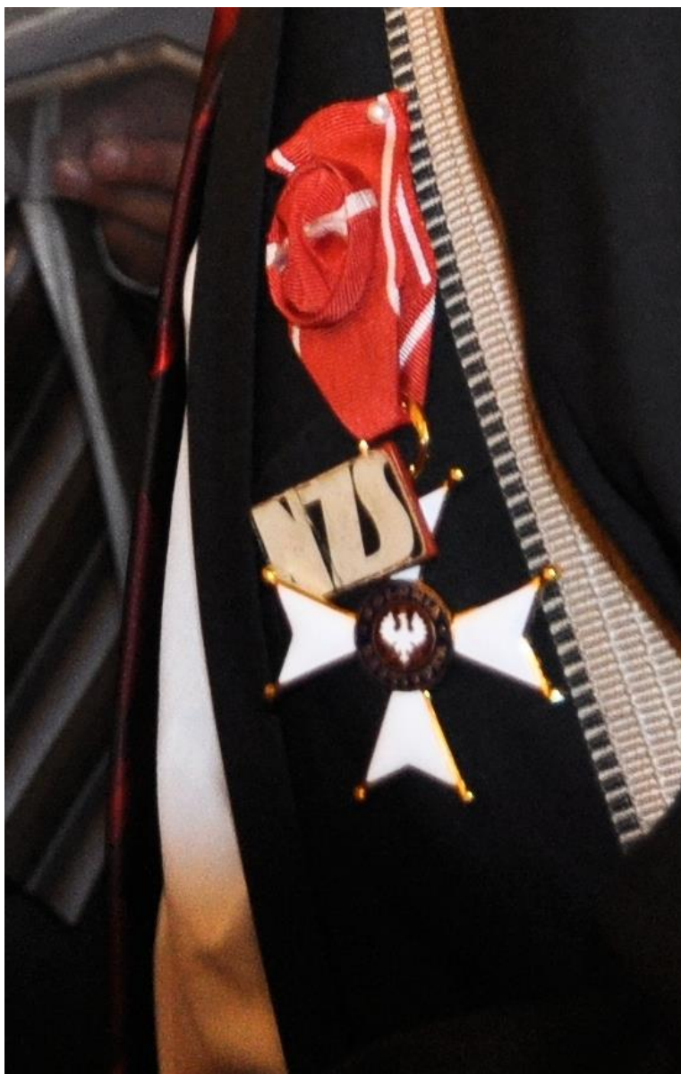
Odznaczony NZS.