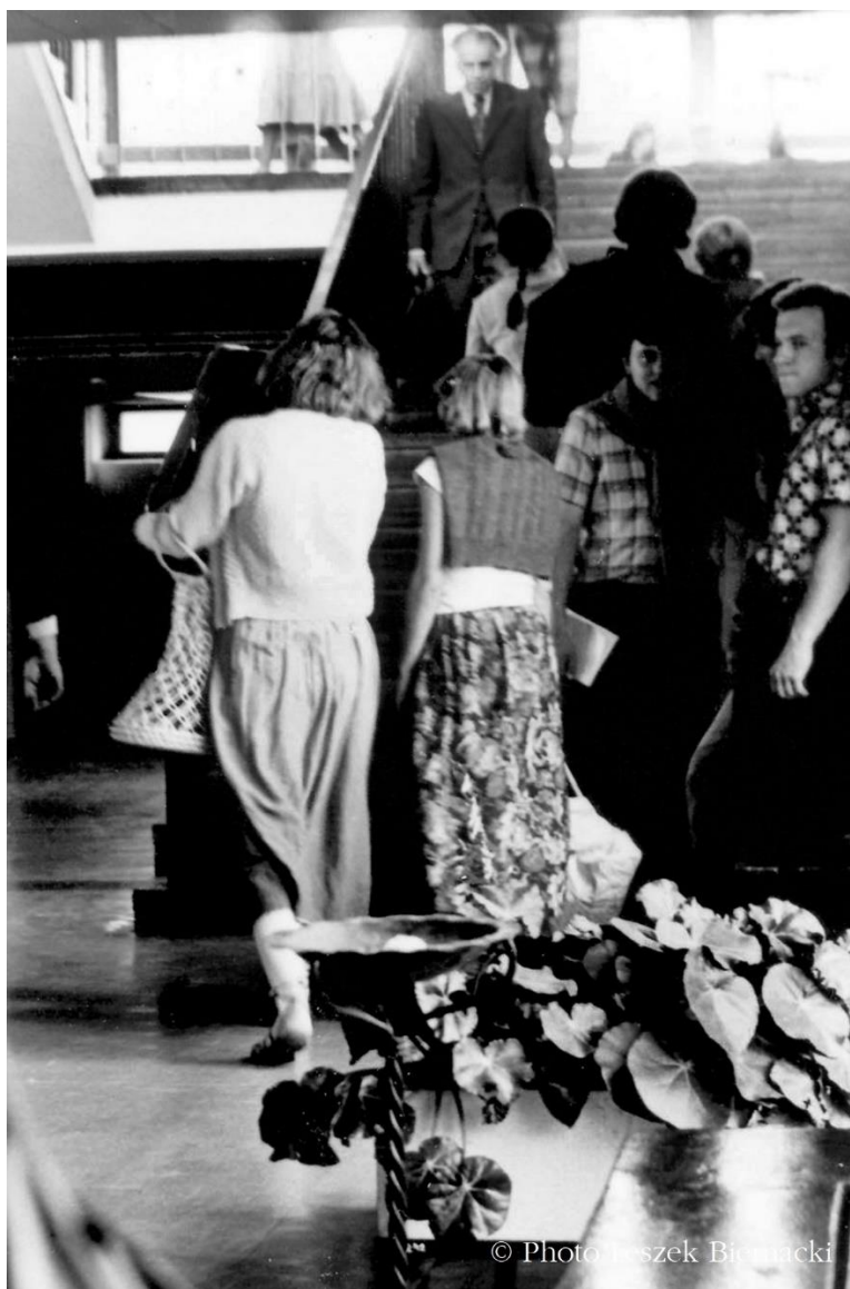
Klatka schodowa na Wydziale Humanistycznym UG w 1980 r.

podpisów pod petycją żądającą zamieszczenia w Dzienniku Ustaw pełnego tekstu Deklaracji Praw Człowieka i Obywatela ratyfikowanej przez PRL w marcu 1977 r. oraz pełnego tekstu protokołu końcowego KBWE.