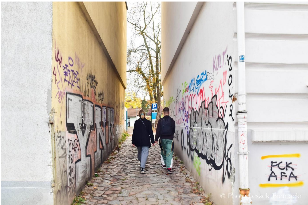
Stary Wrzeszcz.