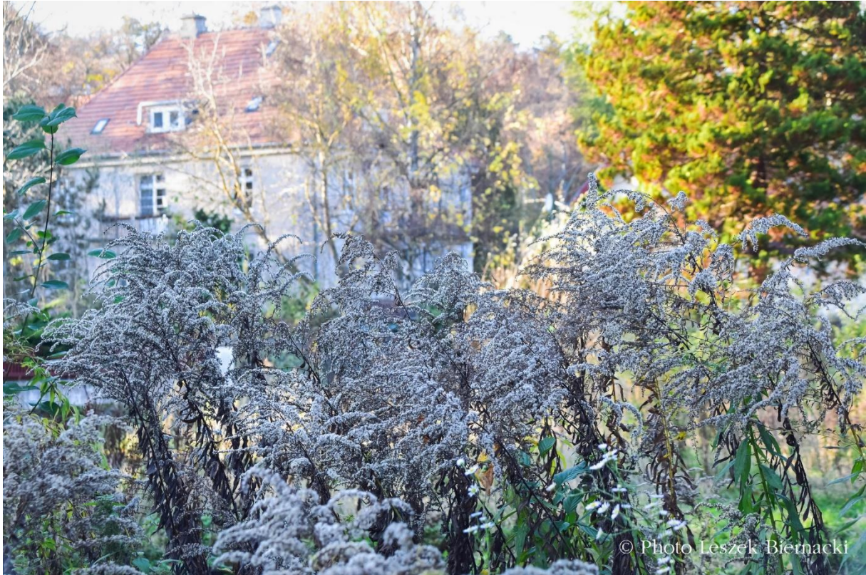
Stara Oliwa.