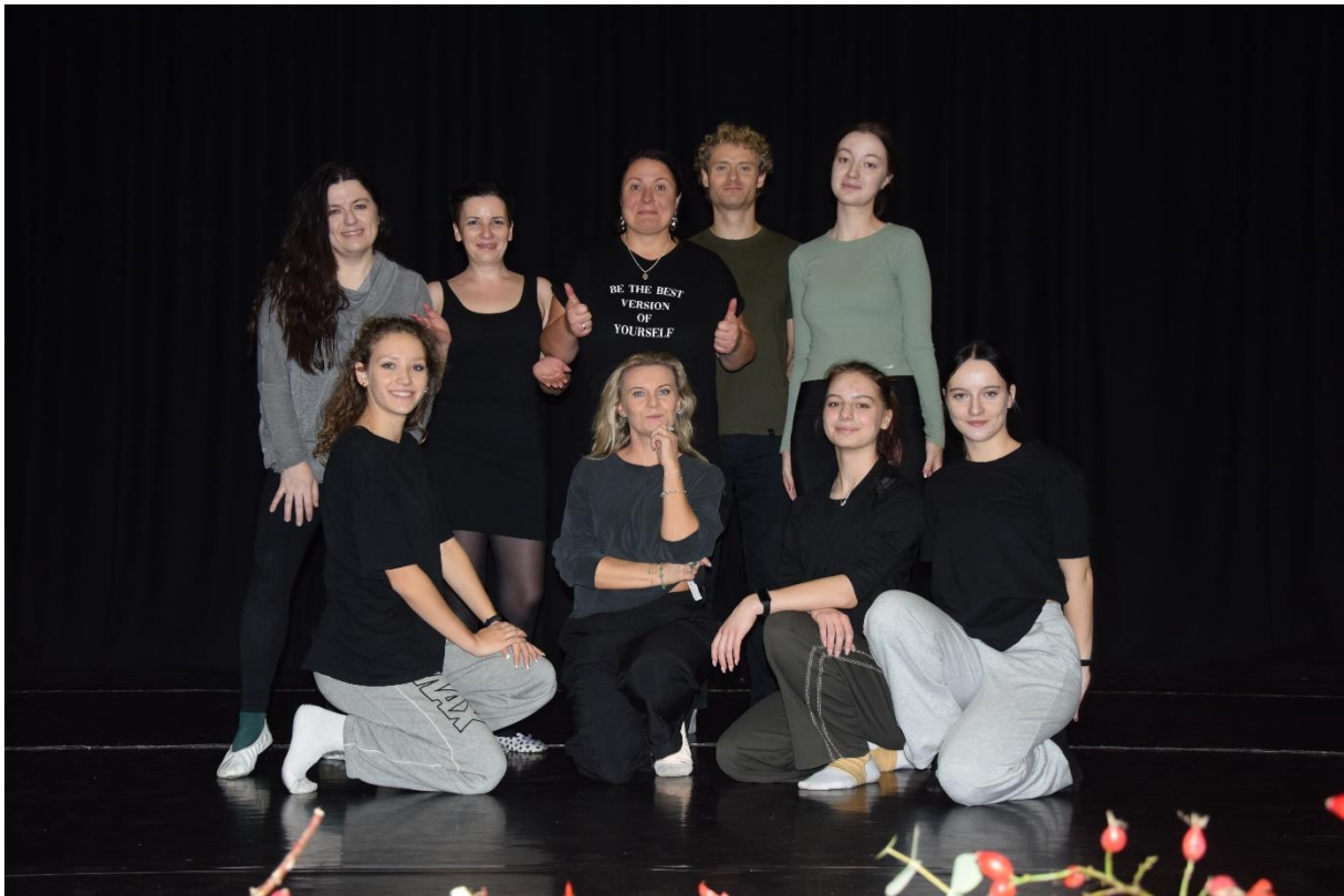
Uczestniczki i uczestnik warsztatu „Ruch na scenie” na scenie” prowadzonego przez Monikę Leśko-Mikołajczyk.