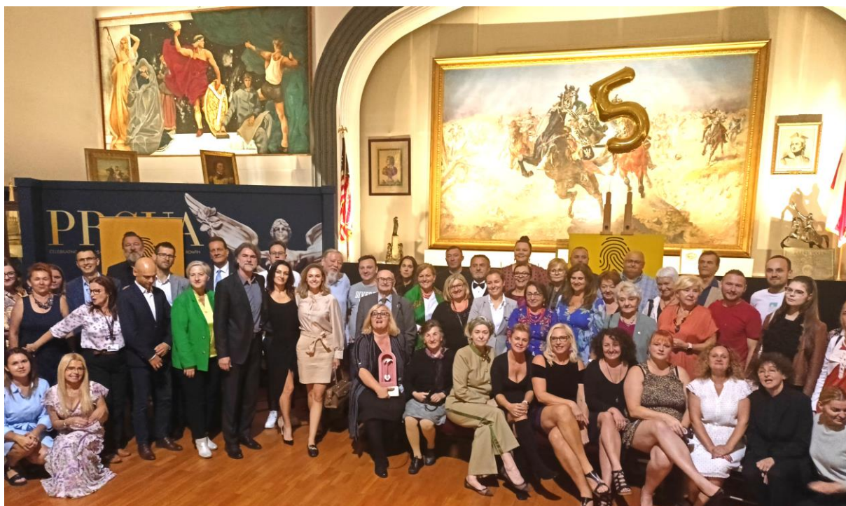
Gala V Kongresu Teatrów Polskich w Chicago