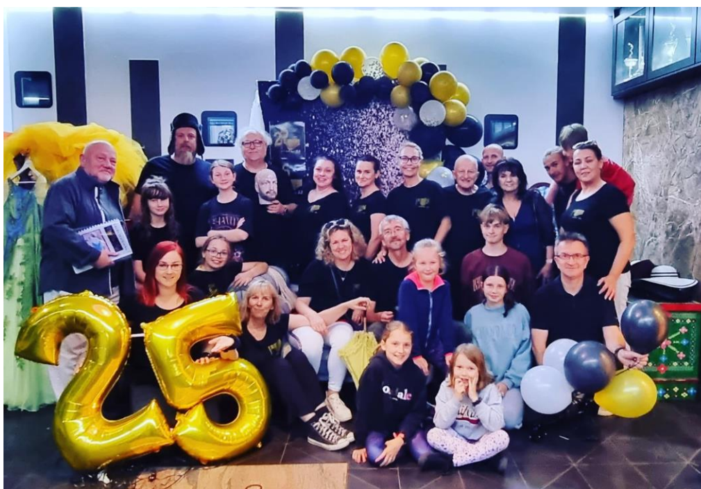
25 lat Teatru Scena 98 w Perth.