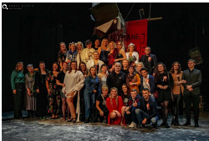
Po pokazie spektaklu „Bal w Operze” w Teatrze Starym w Wilnie (daw. Teatrze na Pohulance).